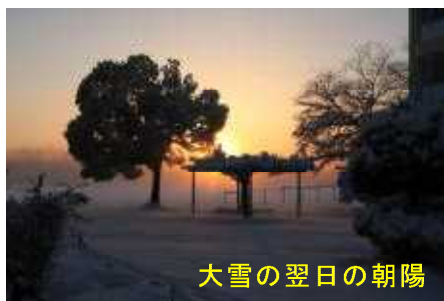
大雪の翌日の朝陽