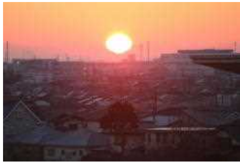
2018年、谷原中屋上より初日の出を望む

1年生の皆さん、16日から、準備を重ねてきたスキースクールがあります。たんにスキーの技能を習得するだけでなく、この学年最大の行事を通して学年や学級の絆や団結、友達との